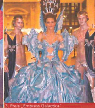
3. Preis „Empress Galactica“ von Matthias Maus