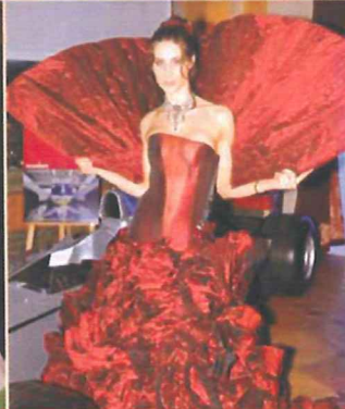
2. Preis „bouquet en rouge“ von Jola Biro