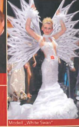
Modell „White Swan“